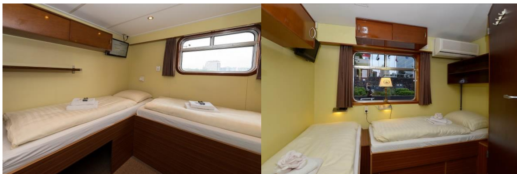
2-Bett Kabine Hauptdeck / 2-Bett Kabine Promenadendeck

Die MS Sir Winston ist ein gemütliches Flussschiff mit Salon und Restaurant im englischen Club-Stil (klimatisiert). Loggia und Sonnendeck mit Sitzplätzen. Die Kabinen sind ca. 7 qm groß, mit ebenerdigen über Eck stehenden Betten und zu öffnenden Fenstern.